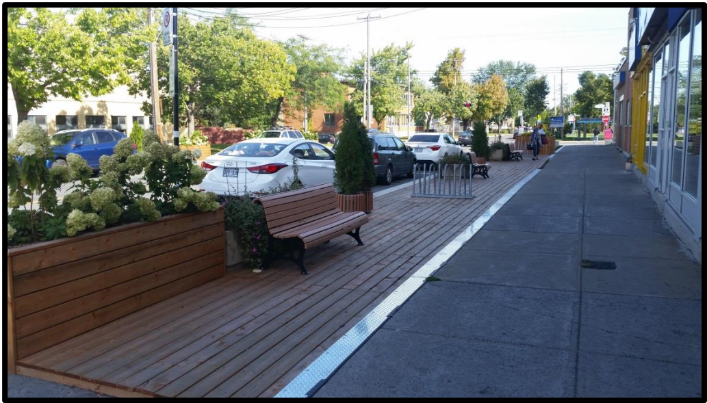
Signature visuelle de la Place Chaumont à Anjou.