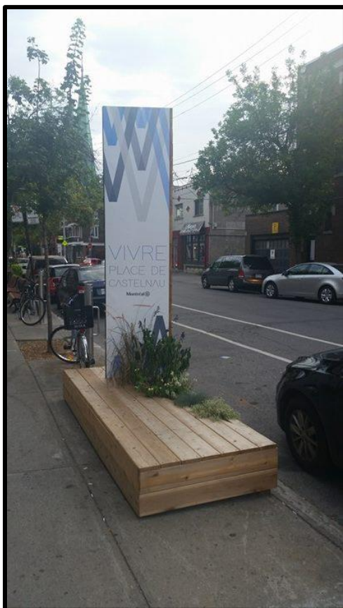
Signature visuelle de la rue Castelnau à Villeray.