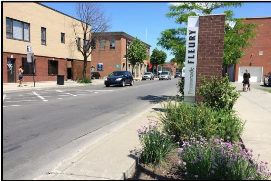
Signature visuelle de la rue Fleury à Ahuntsic.